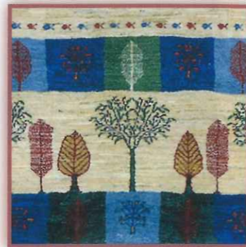
文様に込めた願い

天然羊毛の色調を活かし、大地のような色合いに仕上げたベース。その周囲を巡るボーダーには、様々な樹木が描かれています。木の実が付いた樹木には豊穡を祈り、まっすぐに伸びる糸杉には健康長寿を願い…ひとつひとつのモチーフは、織子さんの「心」の現れなのです。何千キロも離れた異国で織られるギャベにのせた想いと、私達の想いと繋がり、神秘を感じずにはいられません。